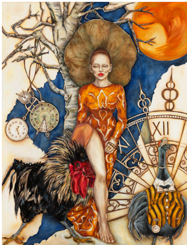
La Fuite du Temps - La semeuse

> Vernissage samedi 18 mai à partir de 18h