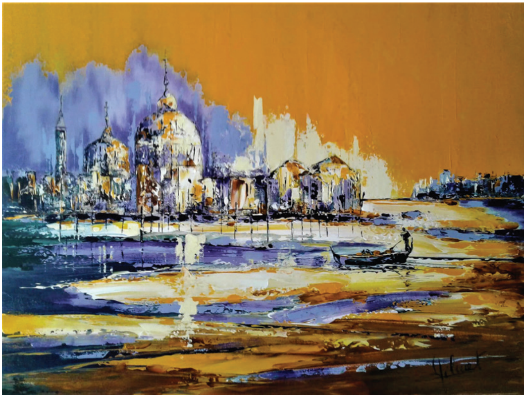
Venezia, la serenissima

> Vernissage samedi 9 septembre à partir de 18h