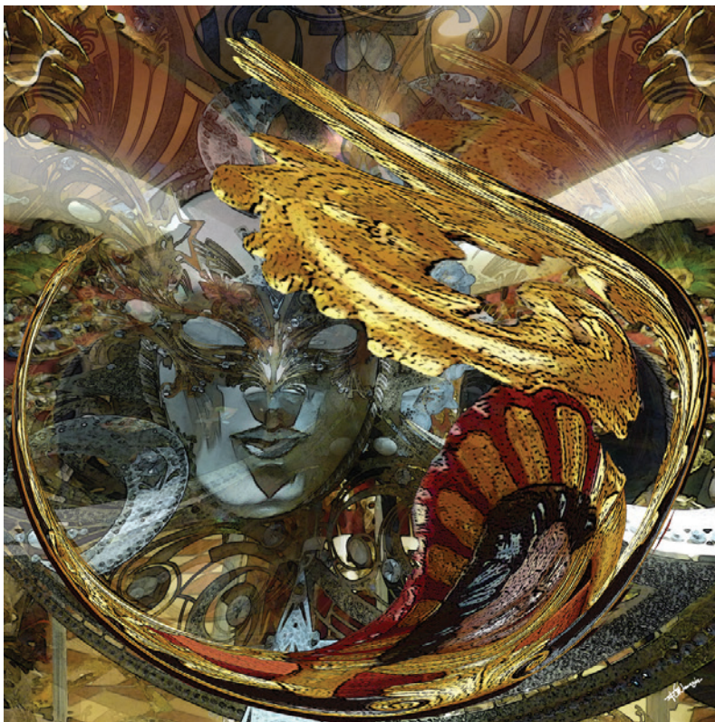
Collection Les suites vénitiennes

> Vernissage vendredi 29 septembre à partir de 16h durant le festival Cultures & Nous