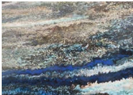
Hamid EL BOUANANI