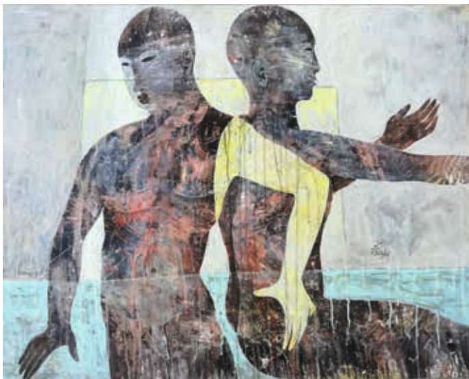
Danseurs -Technique mixte sur toile - 73 x 92 cm

› Vernissage samedi 9 avril à partir de 18 h