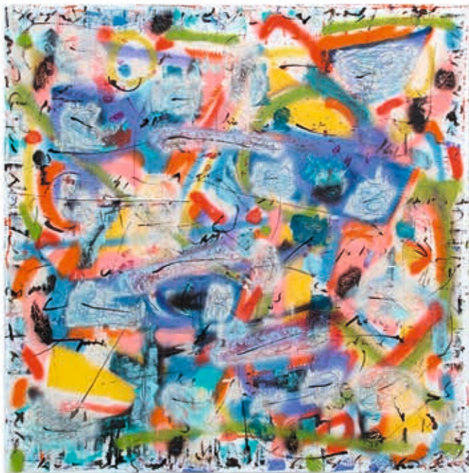
Œil du tigre- technique mixte sur toile - 100 x 100 cm

› Vernissage samedi 14 mai à partir de 18 h