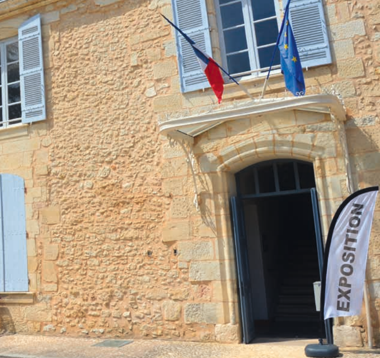
Le château de Saint-Laurent sur Manoire : l'entrée de l'exposition