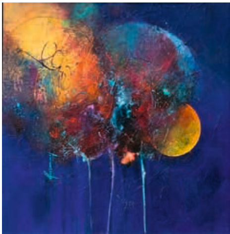
Dominique DESREUMAUX - Fusion - 50x50 cm

Vernissage samedi 11 juin à partir de 18 h