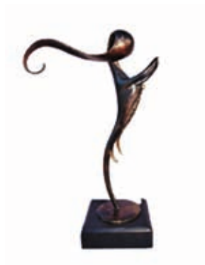
Ibrahim TRAORÉ - Sirène - 43,5x 27,5 cm