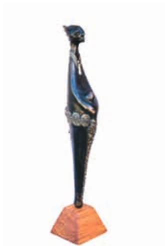
Bamadou TRAORÉ -Biko-53x12,5 cm