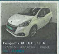
Peugeot 208 1.6 BlueHDi 12/2016 - 42732 km - Diesel 10 100 €