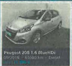
Peugeot 208 1.6 BlueHDi 09/2016 - 65000 km - Diesel 11 390 €