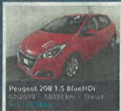
Peugeot 208 1.5 BlueHDi 01/2019 - 5852 km - Diesel 13 180 €