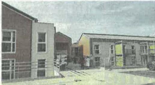
La journée du 25 février était réservée à l'accueil des locataires de la nouvelle résidence Jayanti.