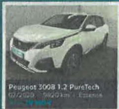
Peugeot 3008 1.2 PureTech 07/2020 - 9620 km - Essence 20 900 €