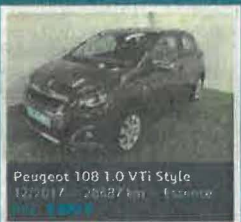
Peugeot 108 1.0 VTi Style 12/2017 - 26687 km - Essence 5 200 €