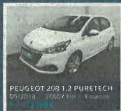
Peugeot 208 1.2 PURETECH 09/2018 - 21007 km - Essence 12 900 €