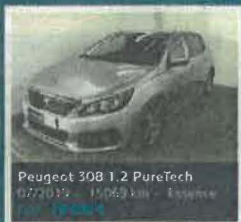
Peugeot 308 1.2 PureTech 07/2019 - 15063 km - Essence 17 900 €