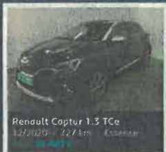
Renault Captur 1.3 Tce 12/2020 - 227 km - Essence 20 400 €