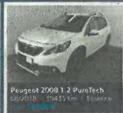
Peugeot 2008 1.2 PureTech 08/2018 - 59435 km - Essence 16 900 €